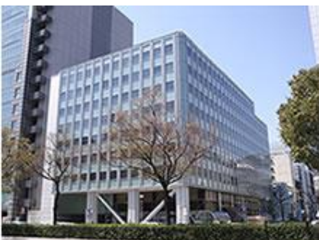
名古屋伊藤忠ビル4階

〒460-0003 愛知県名古屋市中区錦一丁目5番11号 名古屋伊藤忠ビル4階 TEL(052)265-6280 FAX(052)265-6281